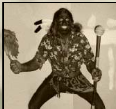
¿Será esta una foto apropiada para uno de estos currícula?

Ante tan maravilloso producto, ¿a qué se debe que la expectativa de vida de nuestros aborígenes no exceda con mucho los cuarenta años, y que sus niños mueran como pajaritos de las enfermedades más tratables del espectro cotidiano? ¿Qué hacen estos