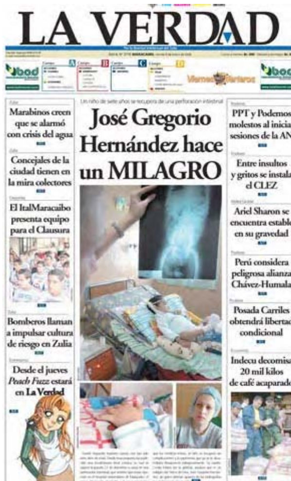
Portada del diario "La Verdad" de Maracaibo, 6 de enero de 2006