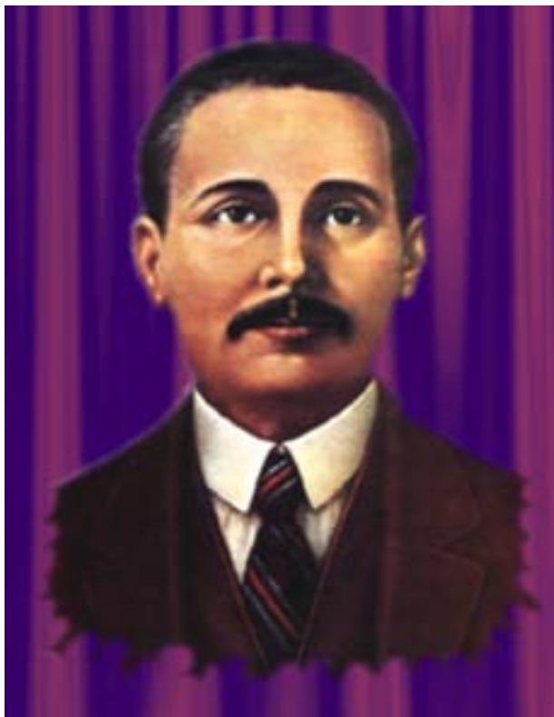
José Gregorio Hernández en una típica estampa popular

José Gregorio Hernández (1864-1919) fue un médico venezolano que se formó en París. Ejerció su profesión en Caracas, donde además fue profesor de la Universidad Central de Venezuela, escribió varios libros,