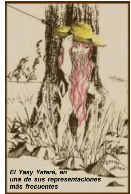
El Yasy Yateré, en una de sus representaciones más frecuentes

- El Nuevo Herald, Miami, Florida, 9 de setiembre de 2005 (no disponible en Internet). - Sobre el Yasy Yateré: www.itunet.com.ar/mitologia/yasy.htm